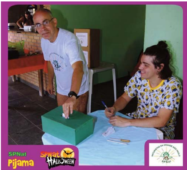
Votaram 49 associados portadores do selo 2015 e adimplentes com a Tesouraria.

Após o término do processo eleitoral, foi feita a apuração dos votos e a elaboração da Ata de Eleição, a ser encaminhada à FBrN Federação Brasileira de Naturismo.